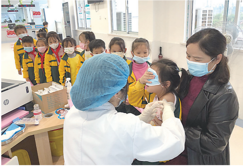
▲孩子们在老师和医务人员的引导下有序接种。

由于3-11岁人群尚未成年,栗雨街道社区卫生服务中心在接种点里安排了有儿科急救急救能力的医疗保障专家团队负责现场急救保障。“接下来的三天内,不要吃海鲜这些易过敏的食物啊,多喝水,还有,24小时内也别洗澡呀!注意休息……”记者看到,医护人员、老师和家长志愿者在孩子们接种