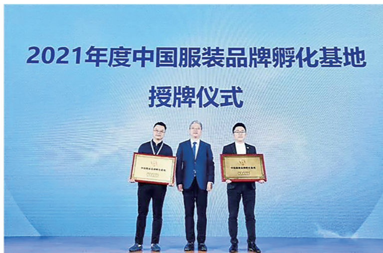
▲今年5月,新华丽市场获“中国服装品牌孵化基地”的专业市场。

接下来,新华丽市场将目光聚焦到每位商户身上,开始全力打造芦淞服饰批发市场4.0智慧升级版,走出了“品牌化”+“新零售”的全新道路。