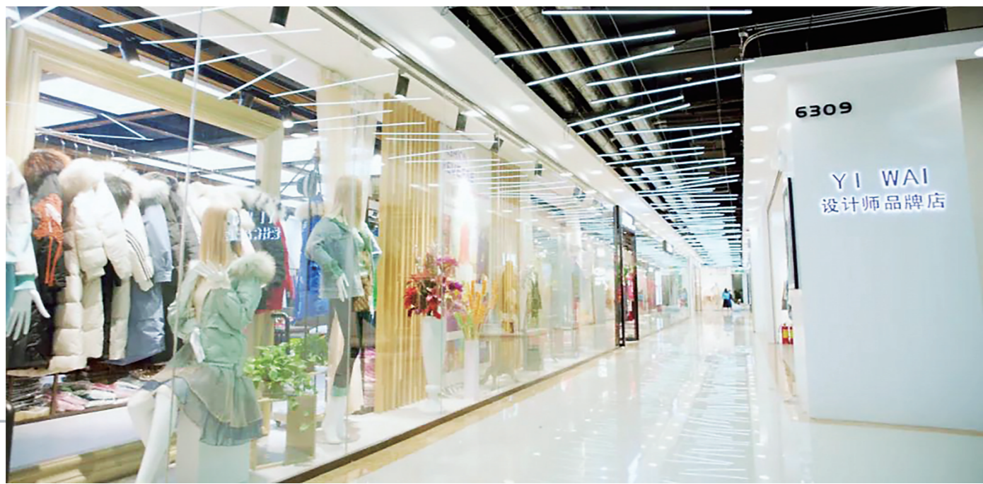
▲新华丽市场的品牌原创中心。芦淞区委宣传部供图