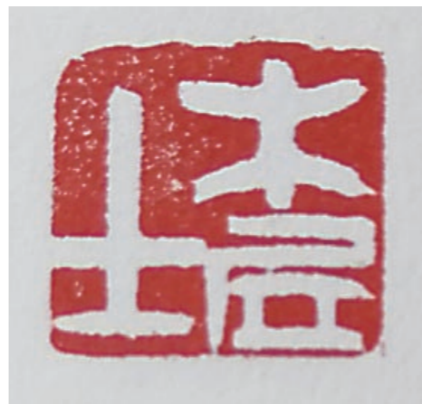
▲齐白石治印:木居士