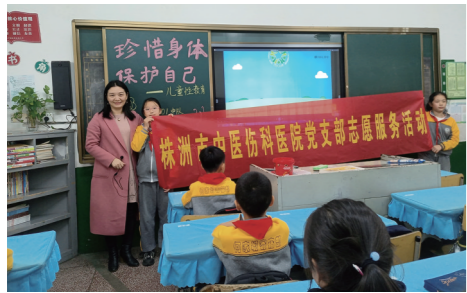
▲“儿童性教育”课堂场景。

本报讯(通讯员/杨蔓 刘泽理)“隐私部位是不能让他他人触碰的,如果有人故意触碰你的隐私部位要勇敢拒绝并告诉家长或老师。”10月22日,芦淞区何家坳小学三(1)班的课堂上,授课老师正在为同学们讲授《珍惜身体、保护自己——儿童性教育》课程。