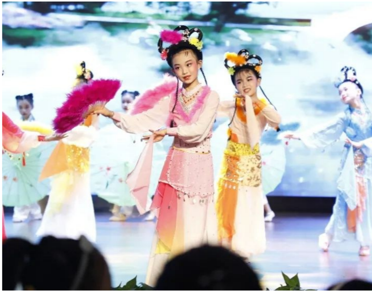
▲孩子们接受传统戏曲熏陶。凌一轩 摄

据悉,该校致力于社团课程的建设和创新,在尊重孩子的兴趣需求和满足孩子个性发展的基础上,整合校内校外优质资源,积极开展各类社团活动。学校不仅有纳入课程内容的社团,还有91个精品、特色化社团供学生选择,促进学生个性发展,让社团成为孩子们五彩童年梦的摇篮。