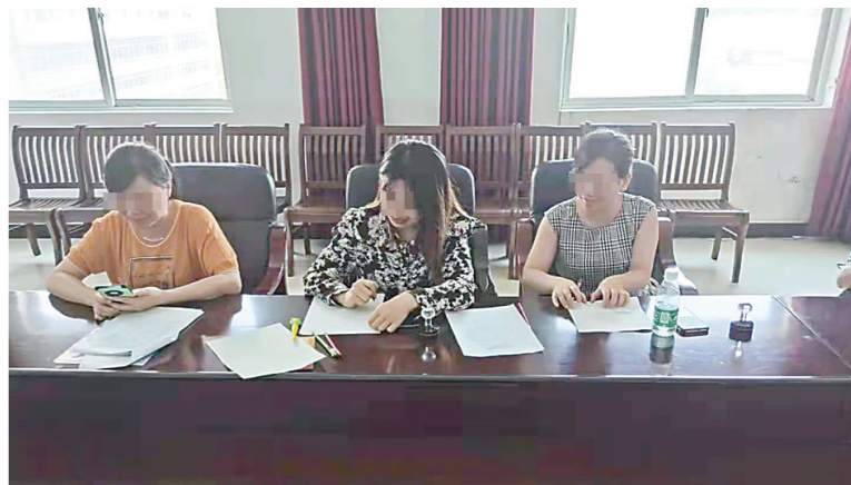
▲市市场监管局办案人员组织并督促当事人现场将多收电费退还给用户。

在国家商标局注册,且并未取得商标注册人授权许可。按照《中华人民共和国商标法》规定,该局依法责令当事人立即停止侵权行为,处罚款39000元。