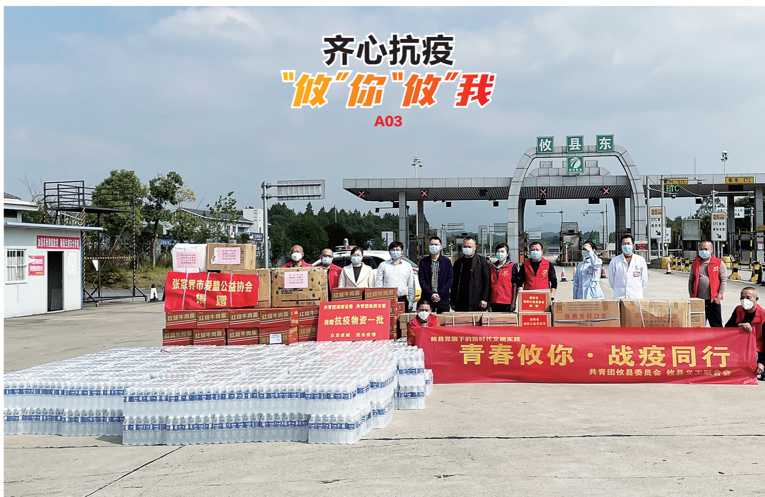
▲近日,攸县打响新一轮疫情防控阻击战,来自社会各界的支持和援助迅速汇聚到攸县,凝聚成战胜疫情的重要力量。图为相关抗疫物资运抵攸县。