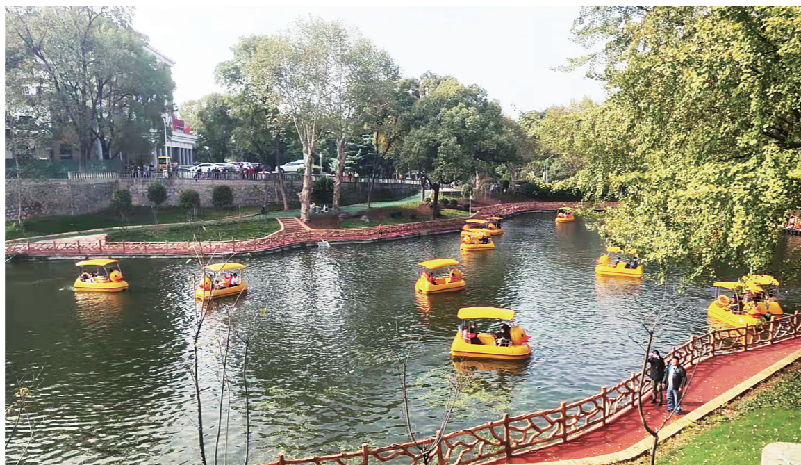
▲阳光甚好,秋意弥漫,神农公园游人如织。