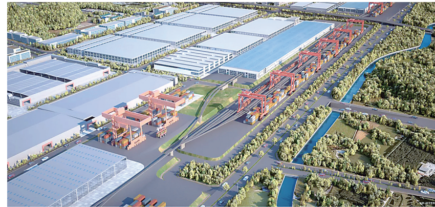
▲三一铁路专线局部效果图。

位于荷塘区的三一智慧钢铁城,是我市正在打造的国内领先的智能制造产业链园区、中部最大的钢铁供应综合枢纽、湖南工业互联网示范园区。三一铁路专线项目