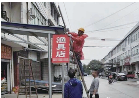
▲店前大棚被拆除。

本报讯(株洲晚报融媒体中心记者/刘平 通讯员/胡蓉)目前,一场“拆棚行动”正在渌口区朱亭镇黄龙村开展。