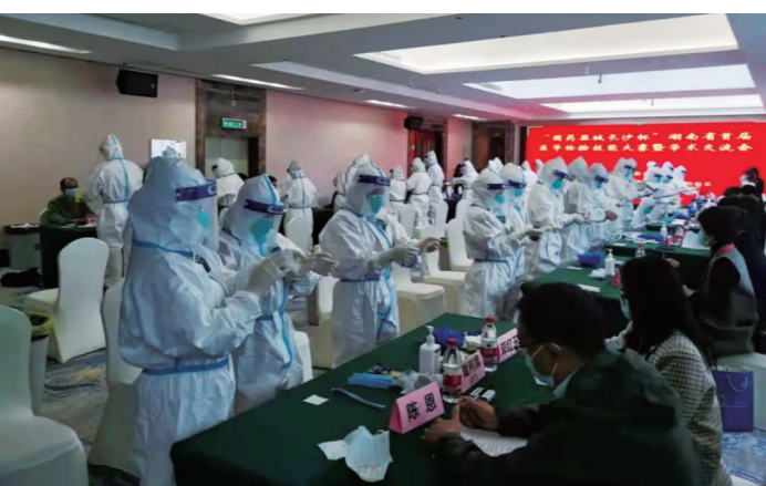
▲核酸检测防护服穿脱竞赛环节

梦想”的口号,沉着冷静、发挥出色,最终以形态学成绩第一名、总成绩第一名勇夺桂冠,荣获团体赛“特等奖”。