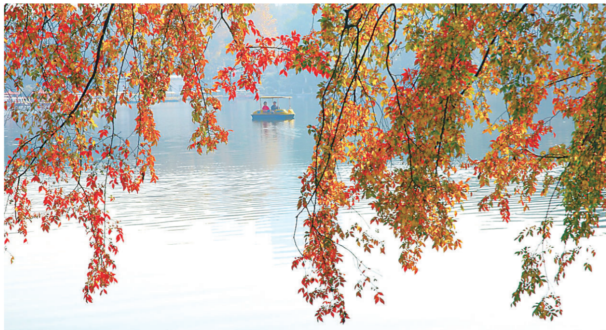
▲近日,深秋的神农公园,湖面上游客驾驶着游船,饱览着如画秋色。