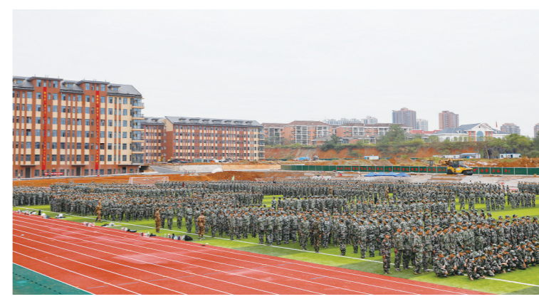
▲湖南铁道科技职业学院新校区,2021级新生正在军训。

窗明几净的新教室、交互式黑板、智慧多媒体教室……漫步新校区,他发现不少亮点。尤其感