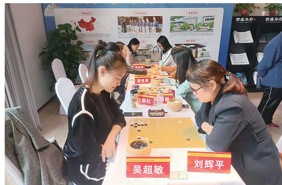
▲两名围棋爱好者正在棋盘上厮杀。

本报讯(株洲晚报融媒体中心记者/温琳)10月18日,为期三天的株洲市第十四届运动会围棋比赛(县市区组、市直机关组)在荷塘区荣盛华府小区开赛,吸引了各县市区及市直机关30支队伍百余名围棋爱好者参赛,是历届市运会参赛人数最多的围棋比赛。近年来,由于我市对围棋项目的普及,越来越多的市民接触并学习这项国粹,并在全省乃至全国一系列赛事中脱颖而出。