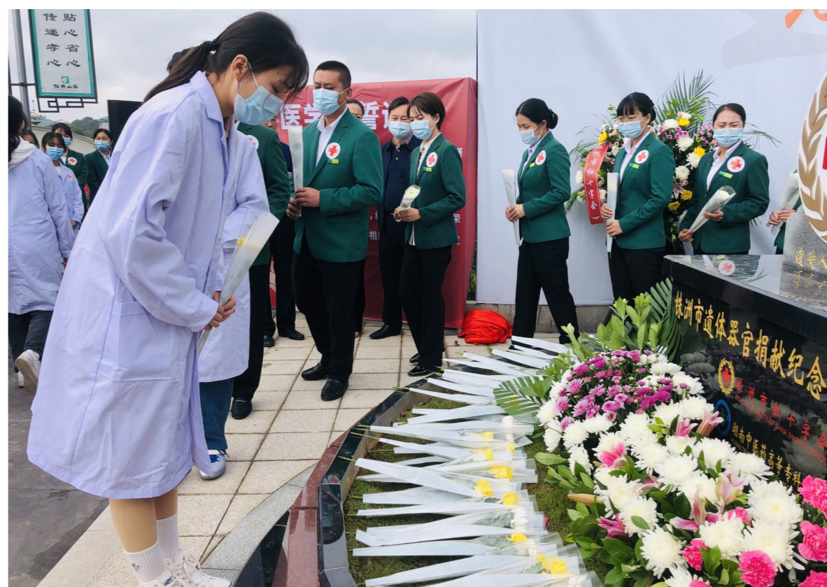
▲医学院学生敬献鲜花,致敬遗体器官捐献志愿者。