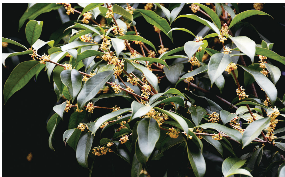
▲八月桂花遍地开,今年由于天气偏热,都农历九月中旬了,文化园的桂花才姗姗盛开。网友“神龙宝刀”摄