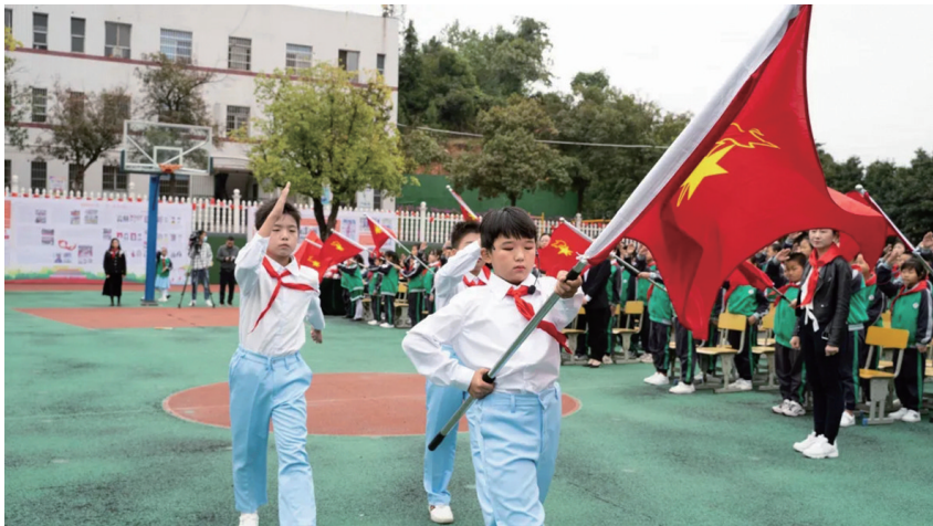
▲株洲市少先队建队日主题活动场景。罗湘娟 摄

一曲童声《党是太阳,我是花》拉开了本次活动的序幕,情景剧《我心中的红领巾》带着与会的所有队员们重温了入队前的知识。接着所有队员们用标