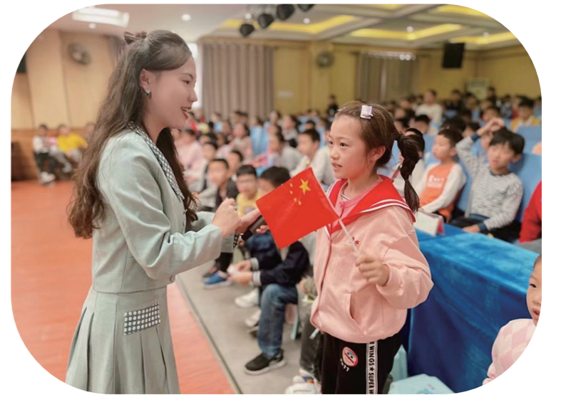
▲图为白鹤小学用英语讲红色故事活动现场。彭慧洁 摄

“用英语讲株洲红色故事”系列活动旨在用英语传承和弘扬中华优秀传统文化和宣讲株洲红色资源。“下一步,我们将引导校园记者走出课堂,用英文进行采访,并且让孩子们到红色景点,尝试当英语讲解员。”活动相关负责人表示。