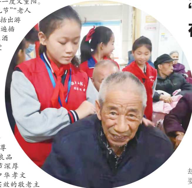
▲金山小学校园记者重阳节敬老活动现场。

重阳节之际,校园内外,尊老、爱老、敬老成为一道独特的风景,营造出社会温暖、家庭幸福、城市文明的浓厚节日氛围。