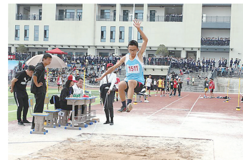
▲学生在跳远赛场比拼。

本报讯(株洲晚报融媒体中心记者/孙晓静 通讯员/张娅露 王鹏)10月12日-13日,第21届天元区中小学田径运动会在隆兴中学举行。来自29所学校的529名运动员,在各类比赛项目中展开激烈角逐。