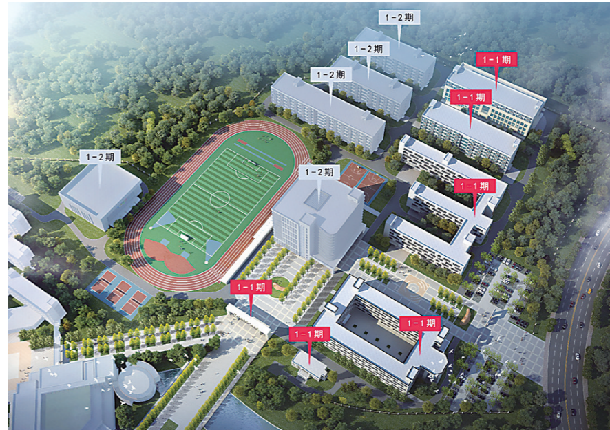
▲校区效果图。

本报讯(株洲晚报融媒体中心记者/戴凛)我市或迎来首个民办高职院校。10月13日,湖南铁航教育发展集团高职校区开工奠基仪式在淞口区举行。该校区落户株洲,将更好地满足长株潭三市学子们对高端、优质职业教育资源的需求,助推长株潭三市优质职业教育资源共享,促进长株潭教育事业高质量发展。