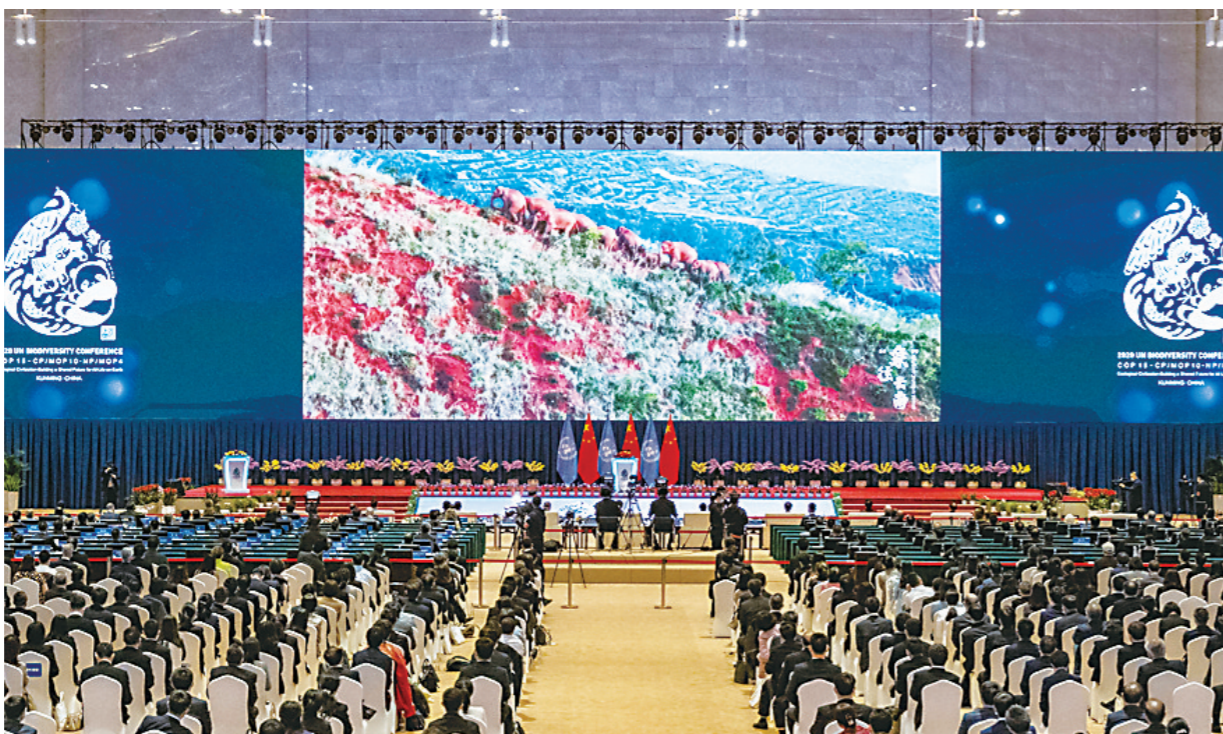
▲开幕式上播放了大象主题短片。