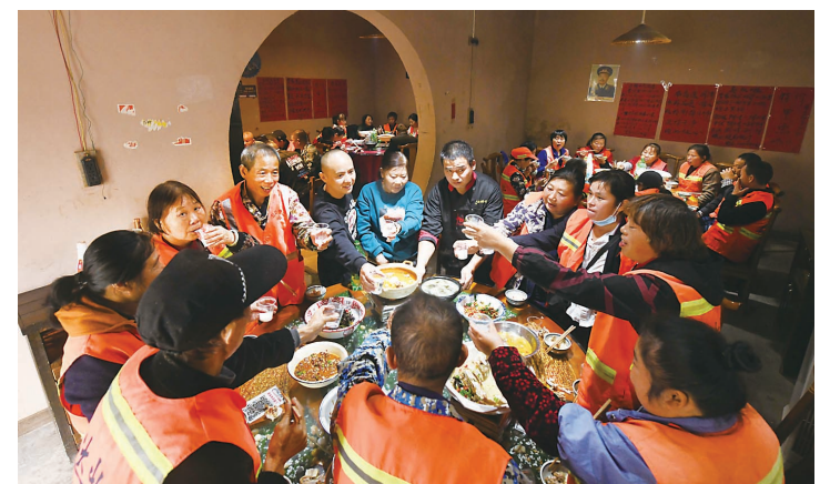
▲10月12日,环卫工人们围坐在一起吃大餐。

今年6月份,法院依法作出判决:董某犯非法狩猎罪,判处有期徒刑3个月;罗某犯非法狩猎罪,判处有期徒刑3个月,宣告缓刑6个月。