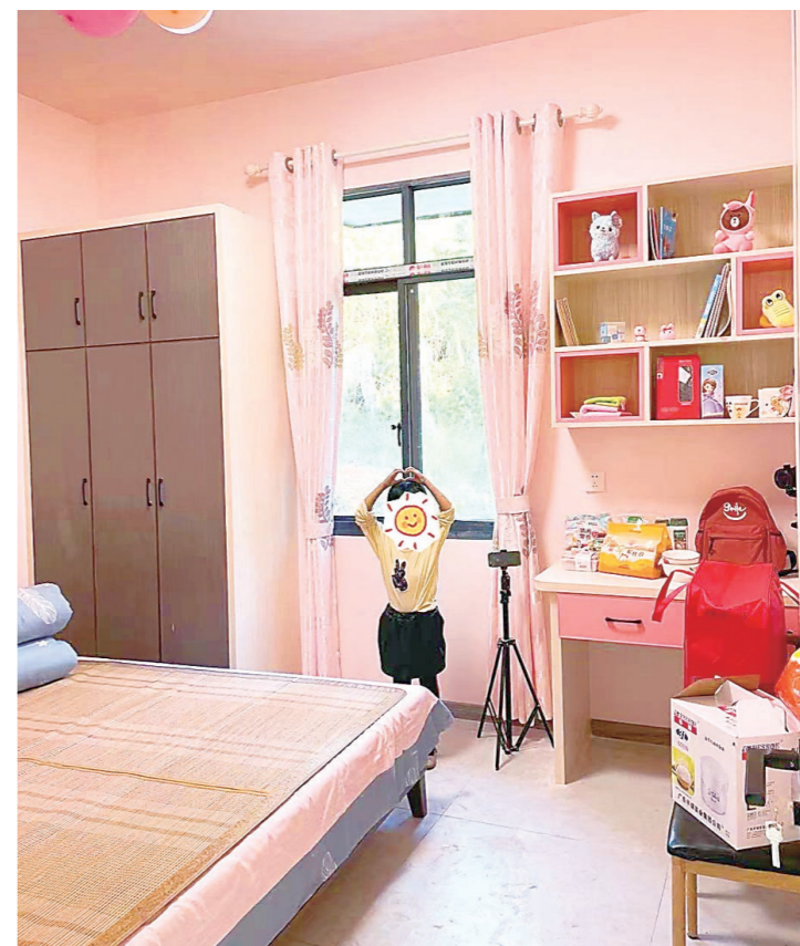
▶小云房间改造之后。