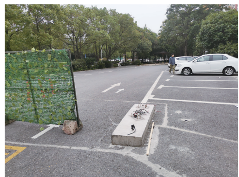
▲亚都花园A栋前坪停车场道闸已拆掉。

本报讯(株洲晚报融媒体记者/姚时美)公家的地私人管理,审批手续不齐全、收费“内外有别”(详见本报7月16日A04、05版)。时隔三个月,昨日,记者对部分未办理备案手续的停车场“回头看”,发现除了个别停车场因工程施工关闭,其余停车场仍未完善手续,继续在收费。