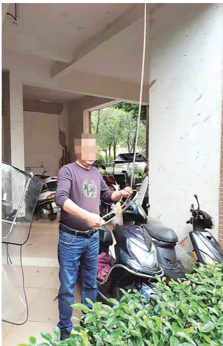
▲居民主动拆除私接的电线。

截至10月10日,已有96名电动车车主领取小区电动车标识,电动车凭标识使用免费充电