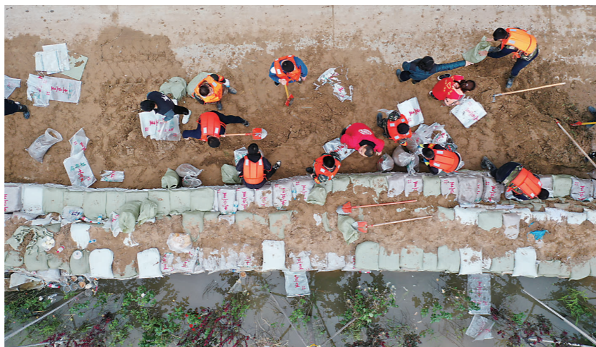
▲在山西省河津市阳村街道连伯村,抢险人员在加固临时堤坝(10月10日摄,无人机照片)。

面对持续强降雨引发的险情,山西省紧急调集人员力量,组织护堤抢险,逐村逐户逐人落实安全措施,按需撤离群众,努力确保重要设施和附近村庄安全。灾情发生后,省、市、县三级应急管理部门已紧急调拨帐篷3975顶、折叠床3212张、棉衣裤3000套、棉大衣16306件、棉被10932床、棉褥8600床等救灾物资用于受灾群众安置。(据新华社)