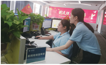
▲国网株洲供电公司坚守电力抢修不停歇,24小时服务不打烊。