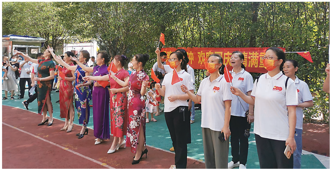
▲文家冲社区开展“乐享文家冲 欢度国庆 情满重阳”系列活动为祖国庆生。

毕亚伟:国家二级心理咨询师,国际心理剧考试委员会认证导演,株洲市中医伤科医院创伤后病人心理干预课题负责人,株洲市红十字会心理援助志愿服务队队长,天元区心关爱社区心理服务中心心理专家,天元区检察院未成年人保护中心咨询师,湖南省红十字会“四星”志愿者。