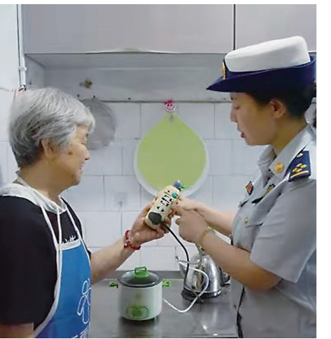
▲消防宣教员向老人讲解火灾防范知识。

近年来,株洲消防救援部门通过走访摸排调查、消防安全隐患排查、宣传教育等工作,走进独居老人家中,送上消防安全“锦囊”。