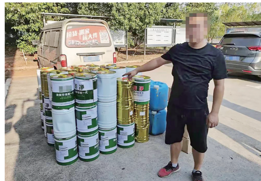
▲杨某指认非法运输的“香蕉水”。