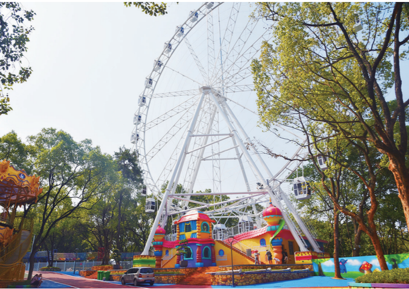
▲神农公园内全新的游乐设施。