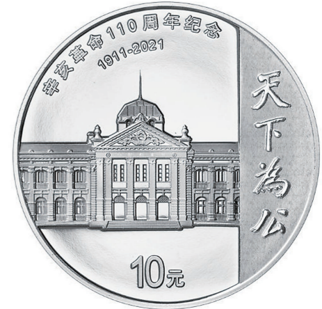
▲30克圆形精制银质纪念币背面图案。

该银质纪念币由上海造币有限公司铸造,中国金币总公司总经销。销售渠道可通过中国金币网(www.cgcccl.net)查询。(本报综合)