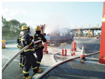
无人员伤亡。

经初步调查得知,这辆货车拉的废旧电池里可能还有余电,电源正负极与金属相碰引发了起火事故。