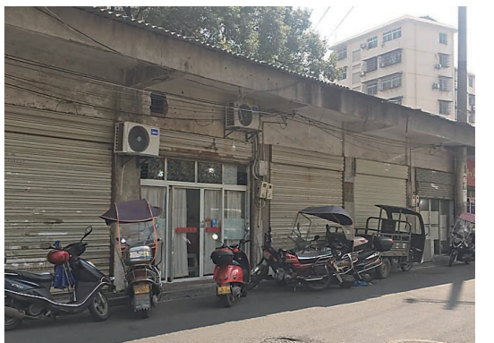
▲一家麻将馆在营业,门前停着多辆摩托车、电动车。

本报讯(株洲晚报融媒体中心记者/刘平)9月27日,有学生家长反映,石峰区北星小学周边分布有多家麻将馆,担心对学生身心健康造成影响,希望有关部门加强监管。