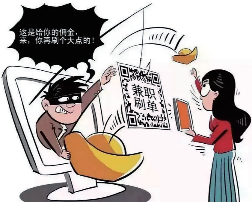
▲在刷单骗局中,骗子往往会先给点甜头,受害者就此放松了警惕。