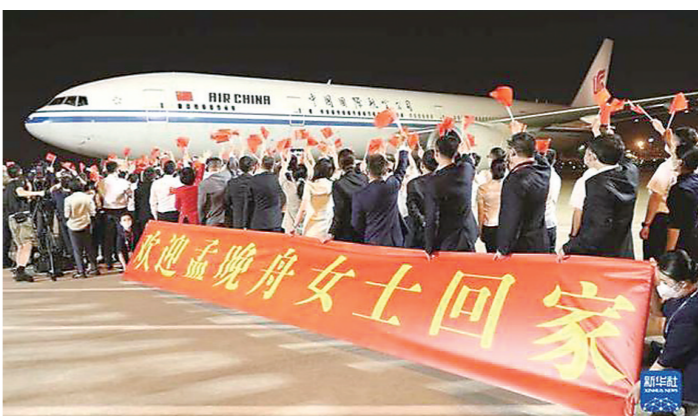
▲市民欢迎孟晚舟回国。

“经过1000多天的煎熬,我终于回到了祖国的怀抱,异国他乡的漫长等待,充满了挣扎和煎熬,但当我走下舷梯,双脚落地的那一刻,家乡的温度让我心潮澎湃,难以言表。”由于疫情原因,现场没有握手,没有拥抱,人们却从