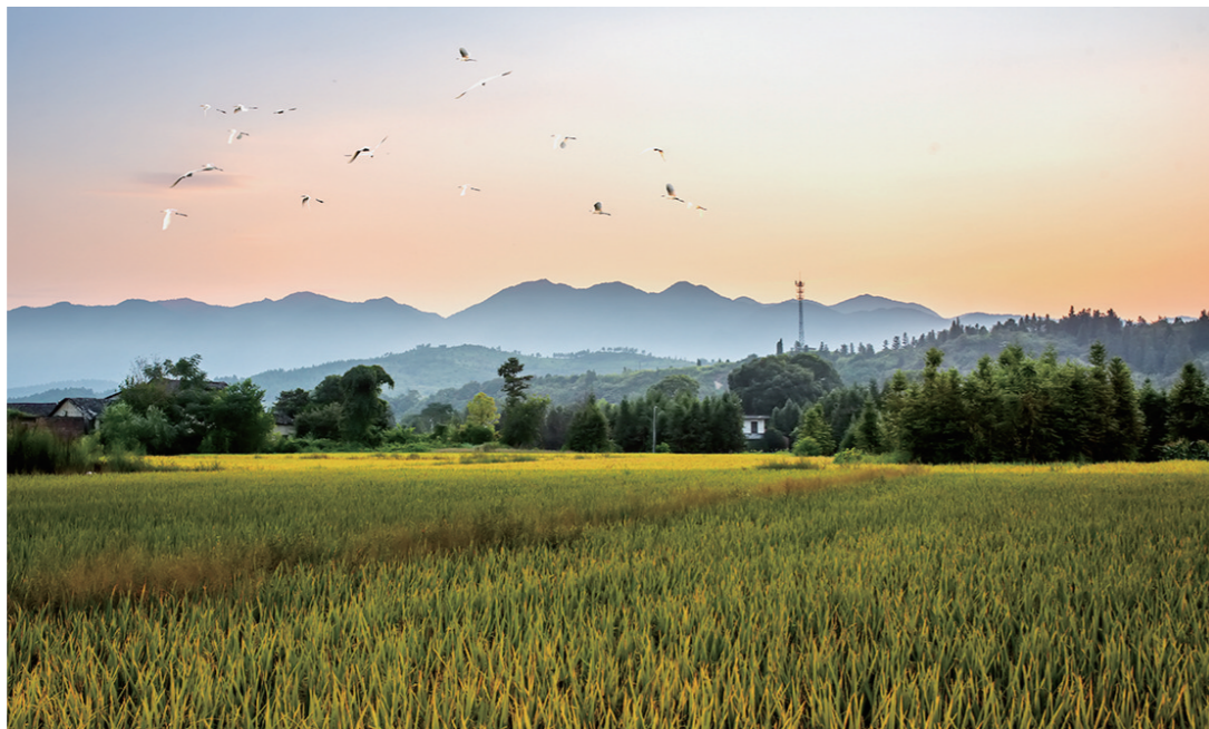
▲青山暮霭夕阳红,稻谷金黄白鹭飞。中秋时节,炎帝陵附近的田园里丰收在望。村庄掩映在茂密的绿树中,静美得令人沉醉。 通讯员/赵劲 摄