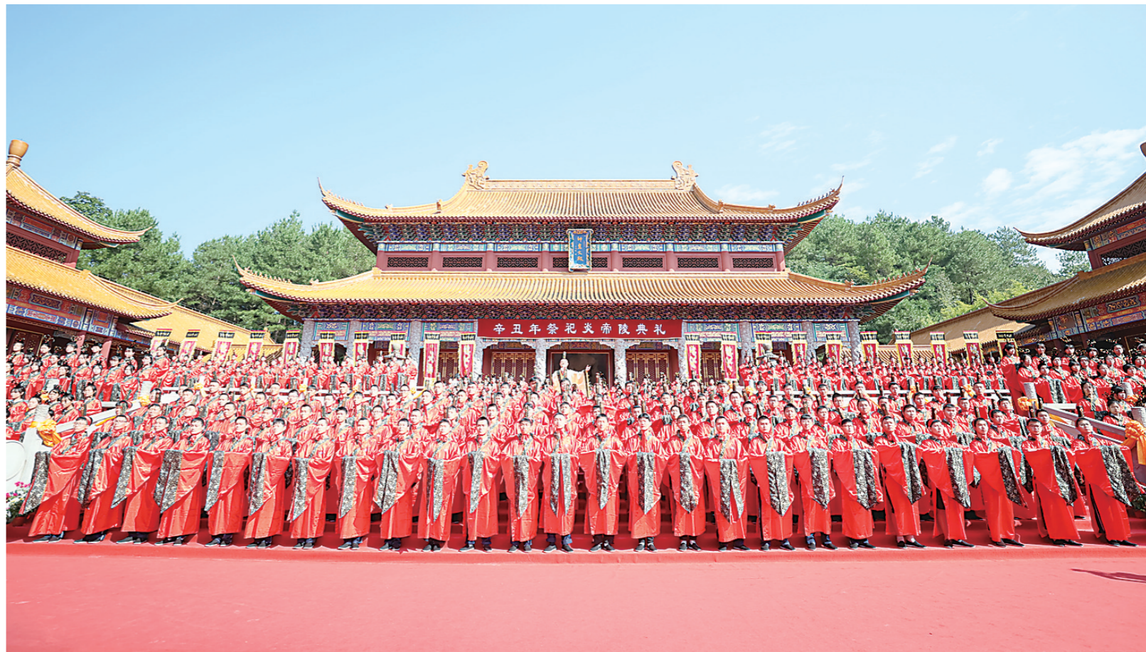
▲昨日上午,辛丑年“祭祀炎帝陵”典礼在中华民族始祖炎帝神农氏陵寝圣地——炎陵县炎帝陵举行。图为典礼现场。