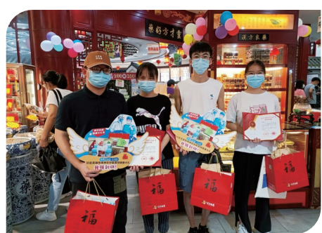
▲抗疫志愿者为神农中医馆公益活动点赞