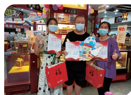
▲抗疫志愿者获赠健康礼包并合影留念

备的健康大礼包,包含护眼贴、痛舒贴、枸杞、红枣、足浴包等。从茶饮到养生小零食,从眼部护理到泡脚养生,不仅方便携带,而且大家可以根据自己的需求使用。我们希望每一位“可爱的人”在疫情结束之后也能关心自己的身体,好好照顾自己和家人朋友。每一份礼包都带着神农中医馆对所有平凡英雄的健康关怀和衷心感谢。 疫情无情,人间有爱。每一位抗疫英雄在高温酷暑下来回奔波的身影都让我们泪目和感动。白色防护服里小小的身体迸发出的强大力量,蓝色口罩下露出的温柔笑容都让疫情中的我们无比安心和温暖。在这场没有硝烟的战场上,他们发出的一束束微光,将漫长的黑夜照亮。在他们收到健康礼包时露出的笑容,说出每一句“谢谢”时,神农中医馆想对他们说一声:“谢谢,你们辛苦了!正因为有你们的前线守卫,才有了我们的后方安康”。 致敬平凡英雄,致敬最可爱的人!