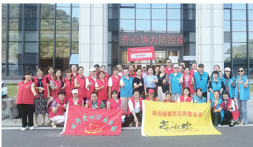
▲醴陵萤火虫助学秋季助学金启动仪式后合影。

9月17日上午7点,在醴陵市顺泽爱心公益协会的支持下,株洲晚报志愿者联合会萤火虫助学行动“情暖金秋·助梦起航”启动仪式在醴陵市成功举行,醴陵市民政局、醴陵市教育局、共青团醴陵市委等单位领导出席了启动仪式。