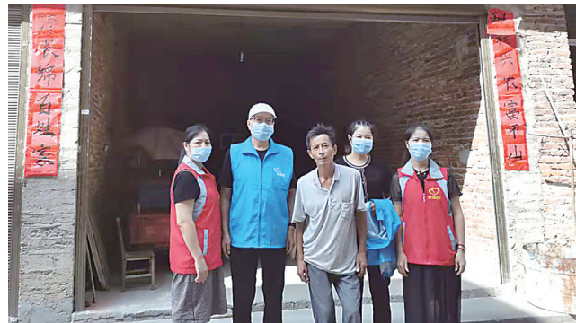
▲炎陵、茶陵地区志愿者为受助学生家建房,但没钱装修了。

9月14日,在炎陵鱼片志愿者联合会的支持下,志愿者带着爱心款,为炎陵地区23所中小学校的57名贫困学生送去助学金,同时还走访了6位贫困学生。70岁的易占蒲先生,也参与了走访的行列。