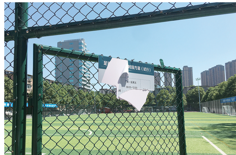
▲足球场一块开放时间公示牌遭到损坏。

本报讯(株洲晚报融媒体记者/刘平)近日,一则“株洲大爷大妈砸锁闯入足球场”的视频引起市民关注。事发荷塘区茨菇塘街道六〇一社区,居民为何要砸开足球场的门锁?9月22日,记者前往六〇一社区展开了走访。