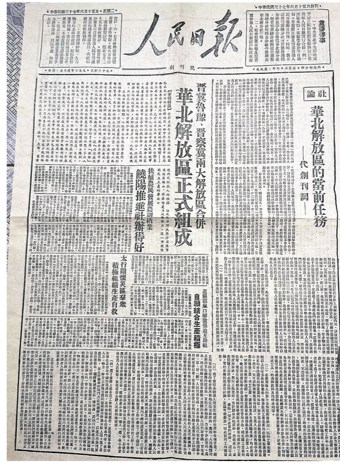
▲作者收藏的人民日报创刊号。

不止一人问过我,究竟是如何得到如此珍贵的《人民日报》创刊号的?这事说来话长。上个世纪八十年代中期,在中华大地上掀起了一股集报热,中国报业协会集报分会也由此而生。集报分会的负责人是《人民日报》的高级