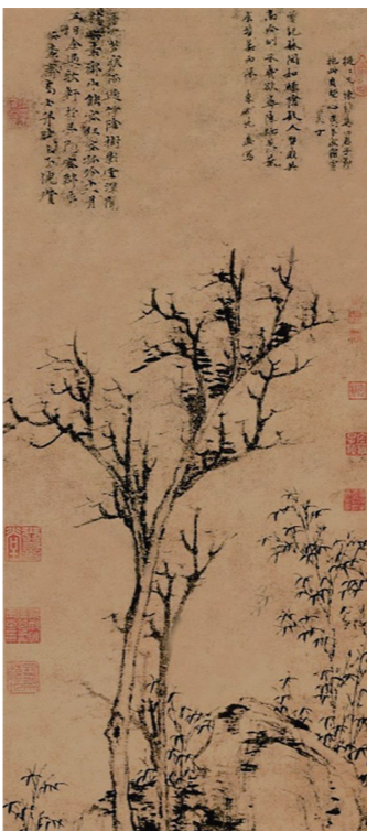
▲倪瓒作品《苔痕树影图》。