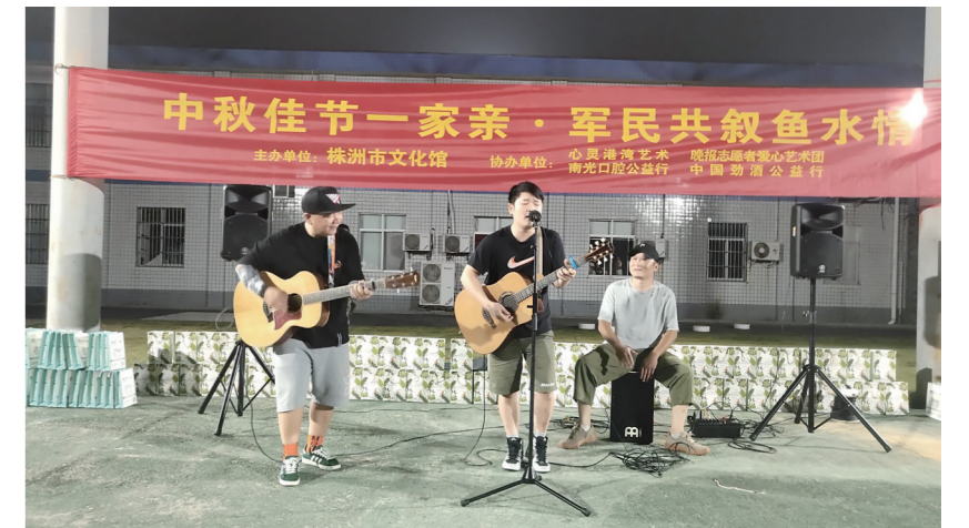
▲中秋晚会现场的精彩节目。

本报讯(株洲晚报融媒体记者/邱鹏)“母亲啊!母亲!我已懂得战士的含义,不付出代价怎能得到胜利……”这是来自石峰区清水塘小学学生的诗朗诵《献给军人母亲的歌》。