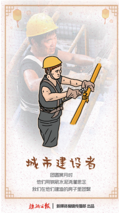
城市建设者 团圆赏月时 他们用钢筋水泥浇灌思念 他们在他们建造的房子团圆