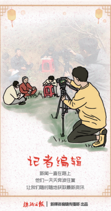
记者编辑 新闻一直在路上 他们奔波于车流人海 让我们随时随地获取最新资讯