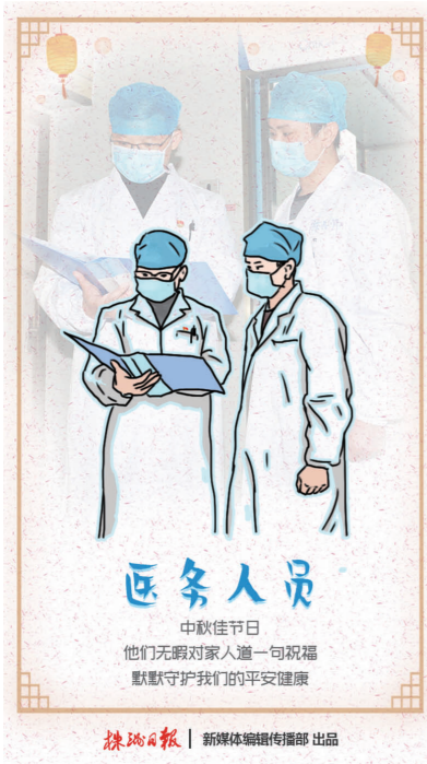
医务人员 中秋佳节 他们无暇对家人道一句祝福 默默守护我们的平安健康