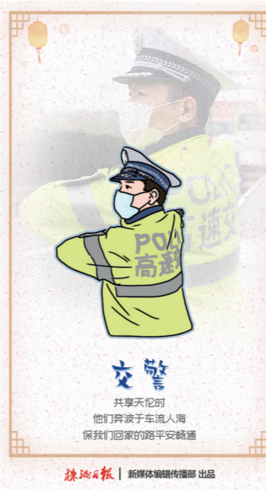
交警 共享天伦时 他们奔波于车流人海 保我们回家的路平安畅通