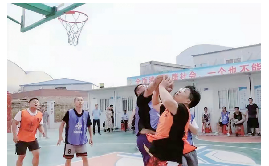
▲“怒江小院”篮球赛现场。

本报讯(株洲晚报融媒体记者/李卉 通讯员/范宜泽)“生活上有什么不便,请及时告诉我们。”“祝大家中秋节快乐。”昨日,中交三航局株洲清水塘项目部相关负责人来到“怒江小院”,为17名傣族和普米族工友送上月饼与生活物资。