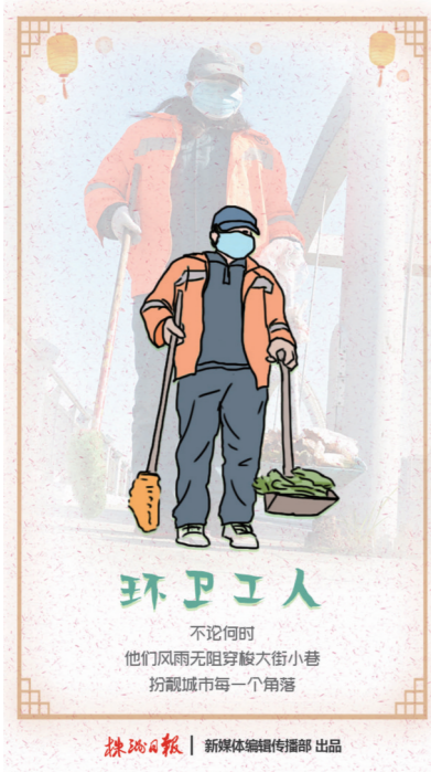
环卫工人 不论何时 他们无惧无惧穿梭大街小巷 扮靓城市每一个角落