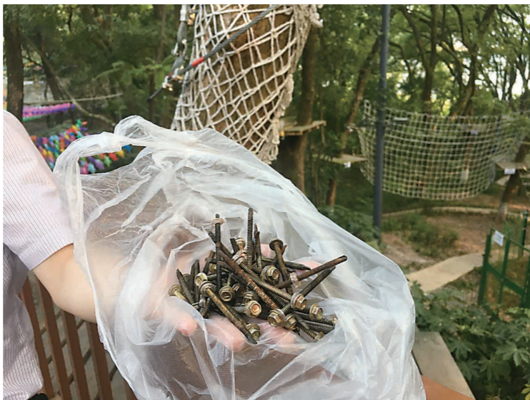
▲从香樟树上拔下的长钉。

领航体育公司负责人表示,公司将进一步对游乐设施与树木的接触部位进行排查,继续对树上存在的钉子进行拔除。