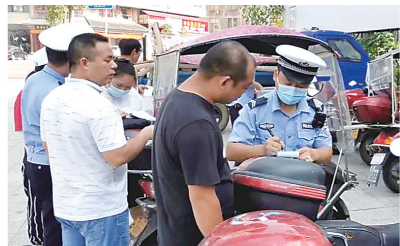
▲茶陵县交警大队查处不戴安全头盔等违法行为。

职权、玩忽职守等刑事犯罪的,一律依法追究刑事责任。对违法违规生产、销售以及发布虚假或引人误解宣传广告造成损害的,引导受害人向人民法院提起民事诉讼,依法追究生产、销售企业相应的赔偿责任。