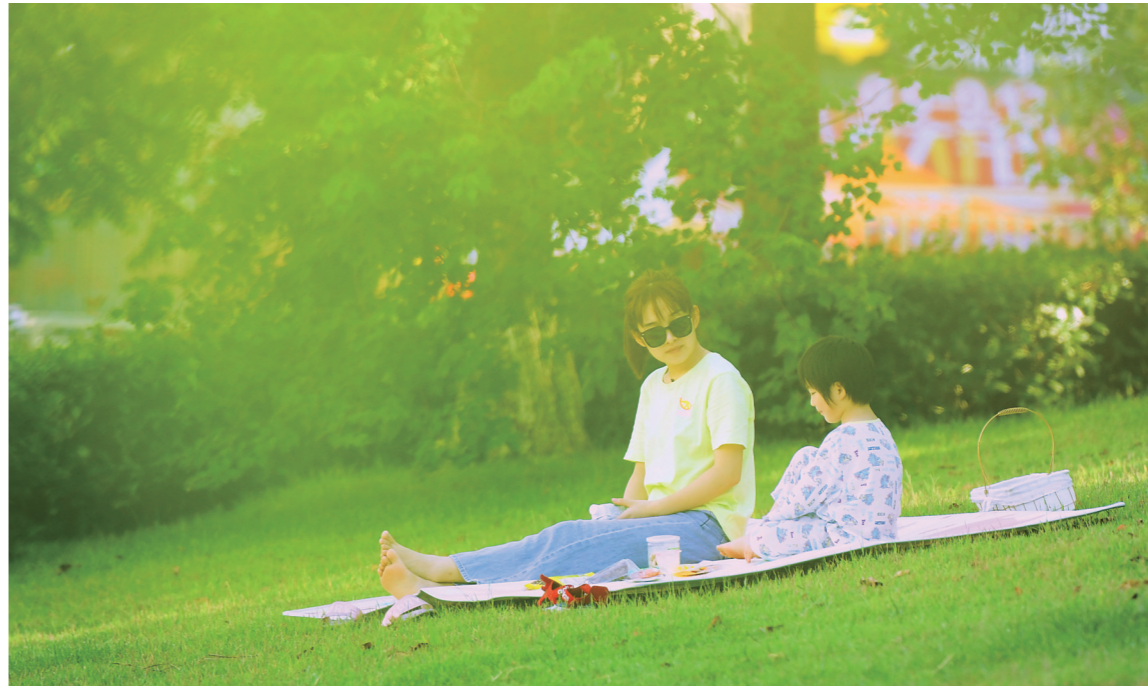
▲近日,神农城,市民带着孩子坐在草地上享受着惬意时光。株洲晚报融媒体记者/谢慧 摄