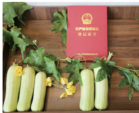
▲“白关丝瓜”获得国家农业部颁发的证书。

本报讯(株洲晚报融媒体记者/杨凌凌 通讯员/罗金鹏)9月14日,“白关丝瓜”收到农业部颁发的农产品地理标志登记证书,“白关丝瓜”被列入我国农产品地理标志保护行列并依法获得保护。