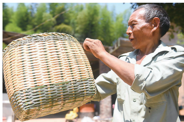
▲编织一个竹篓需要半天时间。