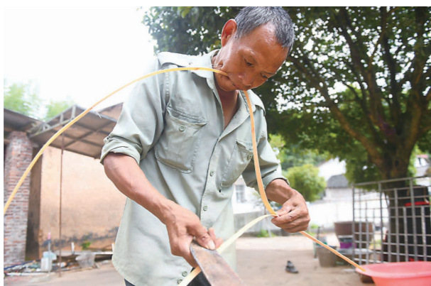
▲用嘴配合着剖篾,厚薄均匀的青篾就诞生了。