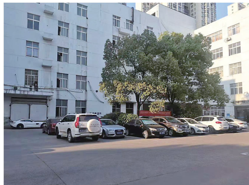
▲没有办下土地证的厂房位于天台金谷。

本报讯(株洲晚报融媒体中心记者/王晖)“我的厂房买了十三年了,因为开发商高科集团在建筑物的‘红线问题’上有问题,所以一直没法办理土地证。”日前,市民李先生在备受困扰之下,拨打了本报新闻热线28829110求助。