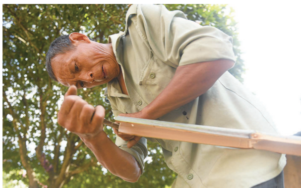
▲几刀下来,一根竹子分成了竹条。