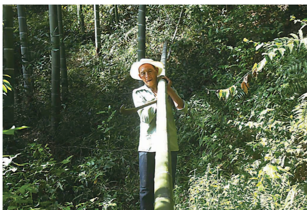
▲宾师傅砍竹子回家。