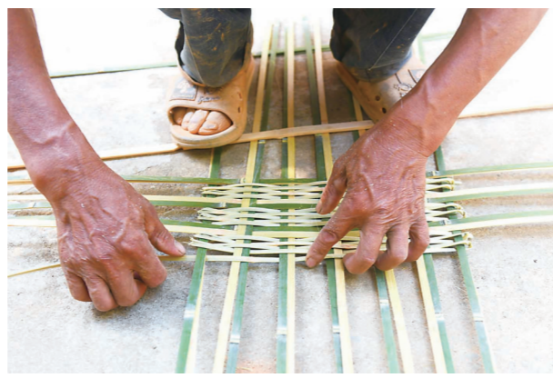
▲篾片准备好后,开始编织。