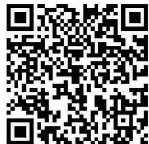
▲扫码看采访视频。 制作:谢慧