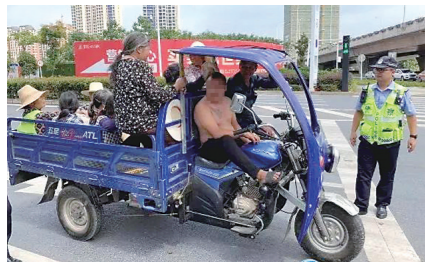
▲民警将违规载客的三轮摩托车拦停。

本报讯(株洲晚报融媒体中心记者/沈全华 通讯员/彭晚华)9月8日上午,市公安局交警支队直属大队民警辅警在云龙大道巡逻时,发现一辆核载1人的三轮摩托车竟挤下11人,如此操作让人惊呆了。