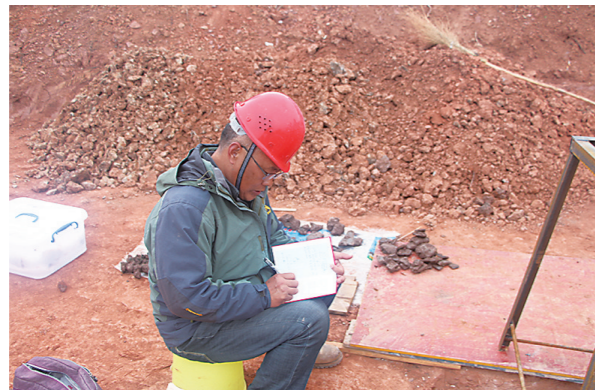
▲考古队员正在进行发掘记录。

里旺古城重见天日 策划/尹二荣 刘小波 执行/株洲晚报融媒体记者 陈驰 里旺古城,位于攸县网岭镇里旺村,历时一年多,从国家文物局批准对南城墙处进行抢救性考古发掘,到今年考古发掘任务顺利完成,不仅确定了古城遗址规模,还发掘出陶高、陶豆、陶盆等上百件文物,取得了阶段性胜利。