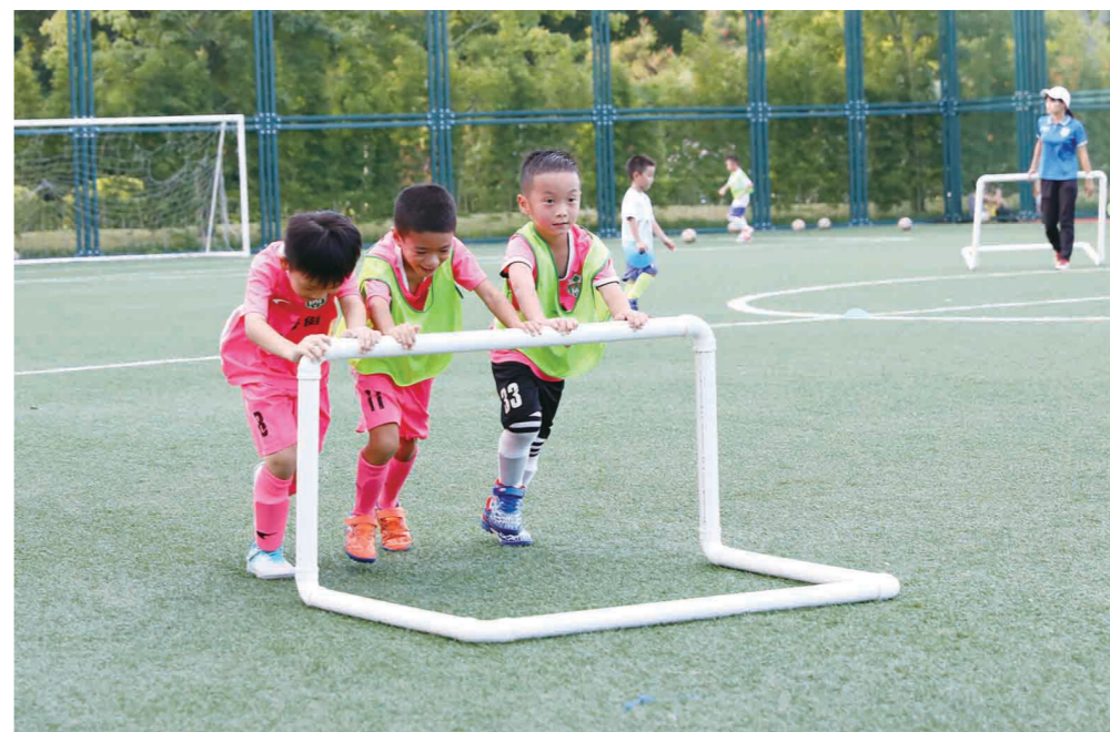
▲9月4日,广州市二沙岛体育公园内,孩子们在推球门架。

国家“双减”政策强调,校外培训机构不得占用国家法定节假日、休息日及寒暑假组织学科类培训。在政策落地后新学期开学首个周末,记者在首批试点城市中的上海、广州、成都、南通等地直击“双减”带来的变化。