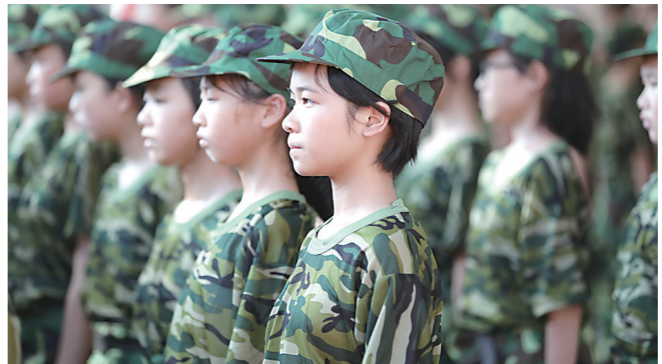
▲ 开学第一课,晨炎学校开展军事训练。