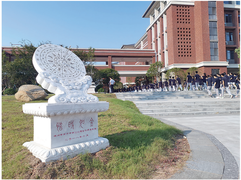
▲ 同学们从操场走进教学楼。