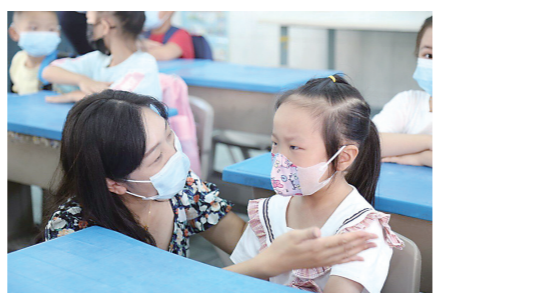
▲一年级的萌娃来到新环境,忍不住哭鼻子,北星小学老师暖心安慰。