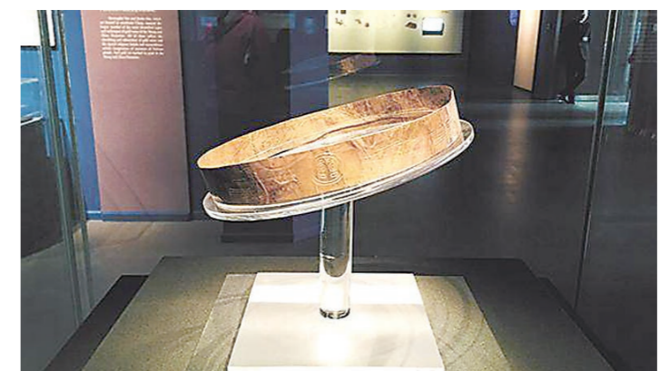
▲国家一级文物金冠带。

一个月后,在金沙遗址内的考古学家们路过工地时,突然看见了那根不起眼的环带。他们小心地把环带捡起来,并将其清洗干净后,那条不起眼的环带变得熠熠生辉。专家确认,这是一件宝物。经过检测,这条金光闪闪的金冠带,已经有3000多年的历史。