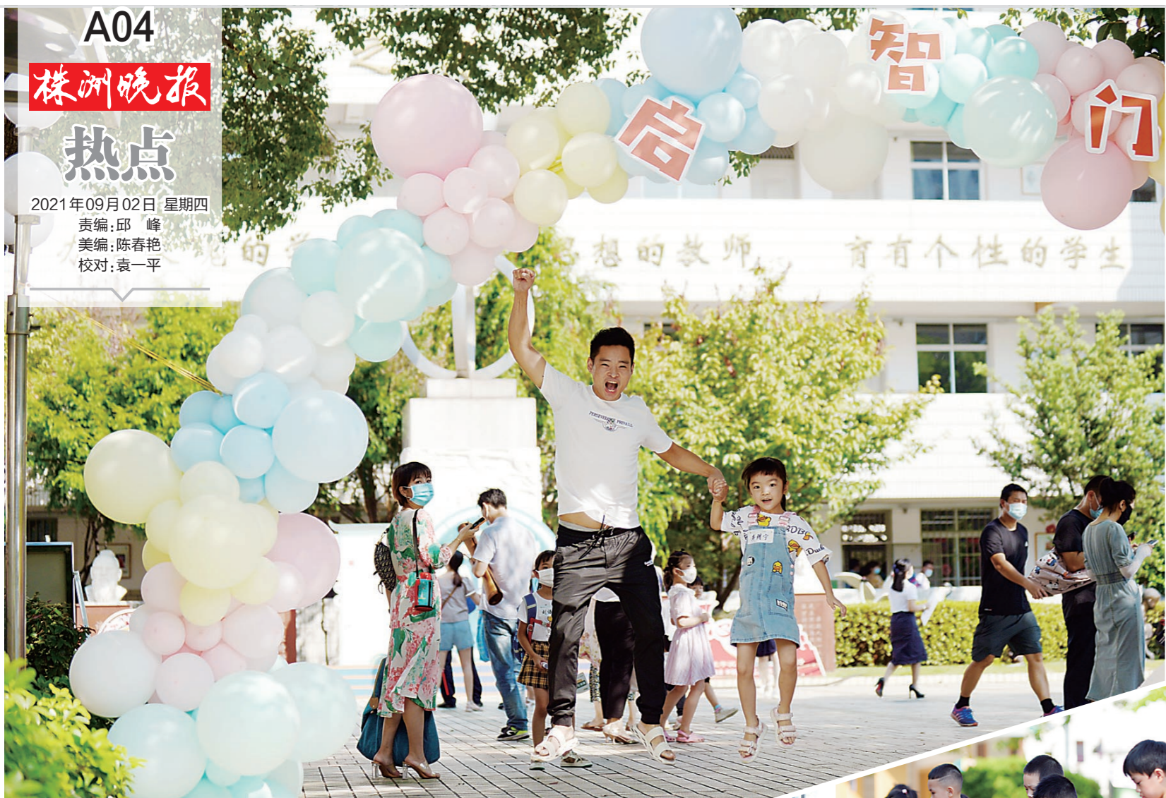
▲在白鹤小学,一名家长带着孩子完成新生入学报到,兴奋得高高跳起。