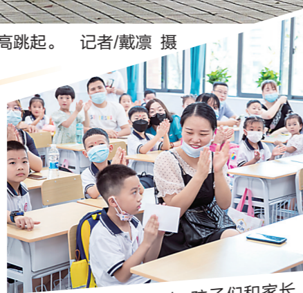
▲在市二中附二小,孩子们和家长互动。