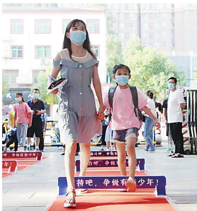
▲高家坳小学,同学们怀揣希望“跨”入新学期。

一年级新生告别幼儿园,逐渐褪下稚气,背起书包走进课堂,一切都是崭新与未知的,一切又都充满梦想与希望。初一新生告别了可以撒欢奔跑的小学校园,从此将以共青团员为榜样……新学期,我们准备好了!