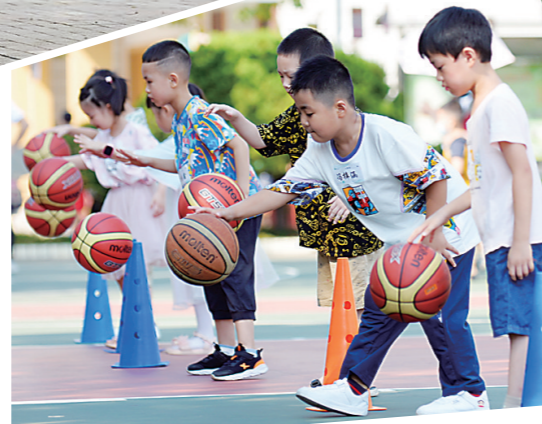
▲白鹤小学,同学们参加篮球闯关游戏。