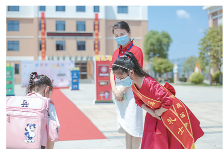
▲何家坳枫溪学校,高年级的“小礼士”迎新生。