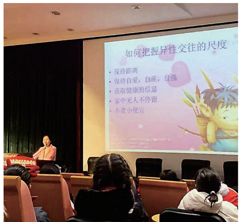
▲学校组织开展青春期教育。

此外,《规定》还特别指出,要有针对性地开展青春期教育、性教育,使学生了解生理健康知识,提高防范性侵害、性骚扰的自我保护意识和能力。