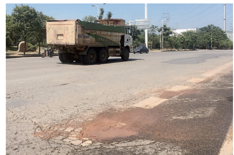
▲铜霞路出现冒泥浆现象。

途经铜霞路的渣土车络绎不绝。8月31日上午,在天元区西环线靠石峰大桥路段,多辆渣土车被交警拦下检查,多名车主因装载不规范受到处罚。有市民表示,希望交警部门加大整治力度,规范渣土车运输。