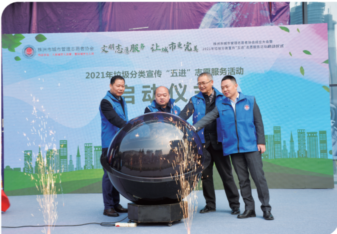
▲株洲市城市管理志愿者协会成立