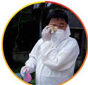
▲城管部门党员志愿者参加抗疫志愿服务