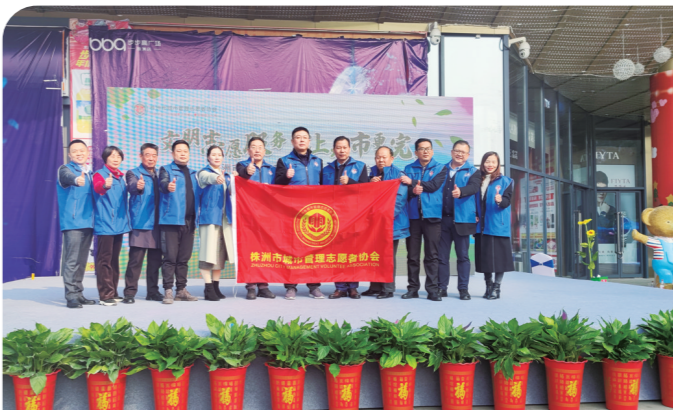
▲城管志协第一届常务理事会