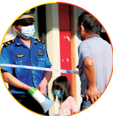
▲城管部门党员志愿者参加抗疫志愿服务

株洲那么美,寻找志同道合的你,和我们一起,让城市更好! 如果你热爱这个城市,欢迎加入株洲城管志愿者先锋队,向共建、共治、共享的创新型城市出发!