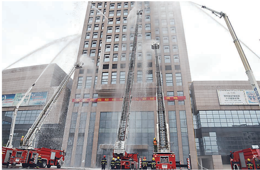
▲多台云梯车参与高层建筑灭火演习。

据悉,我市现有的云梯车拉高度可达54米,并且从地面拉伸登高平台至最高点,全程且需2分钟。同时,该车辆顶部的工作平台可360度旋转,能够克服高空风速影响,方便开展消防救援工作。