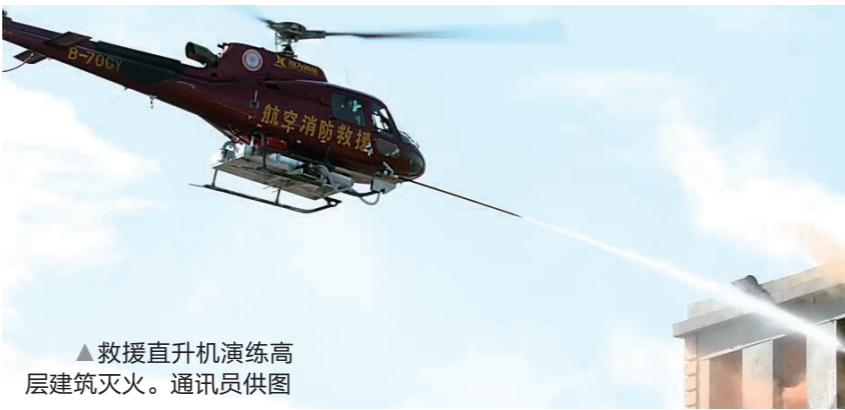
▲救援直升机演练高层建筑灭火。通讯员供图