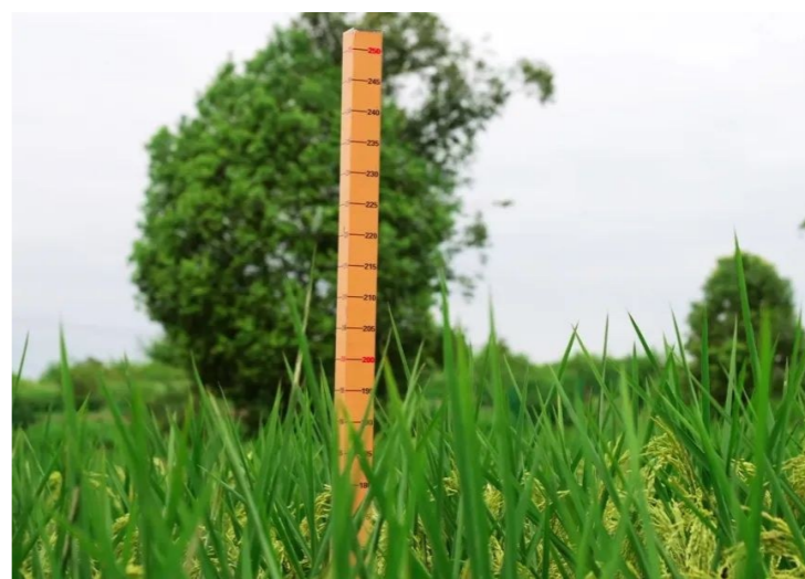
▲长虹村试验田内的巨型稻高度测量标杆。

陈杨朴介绍,巨型稻株型高大、集散适中、叶挺色深、光合效率高,平均有效分蘖达40个,单穗最高实粒数达500粒左右,不仅抗病、抗倒伏能力强,而且耐淹涝、耐盐碱,还能植株带来充分