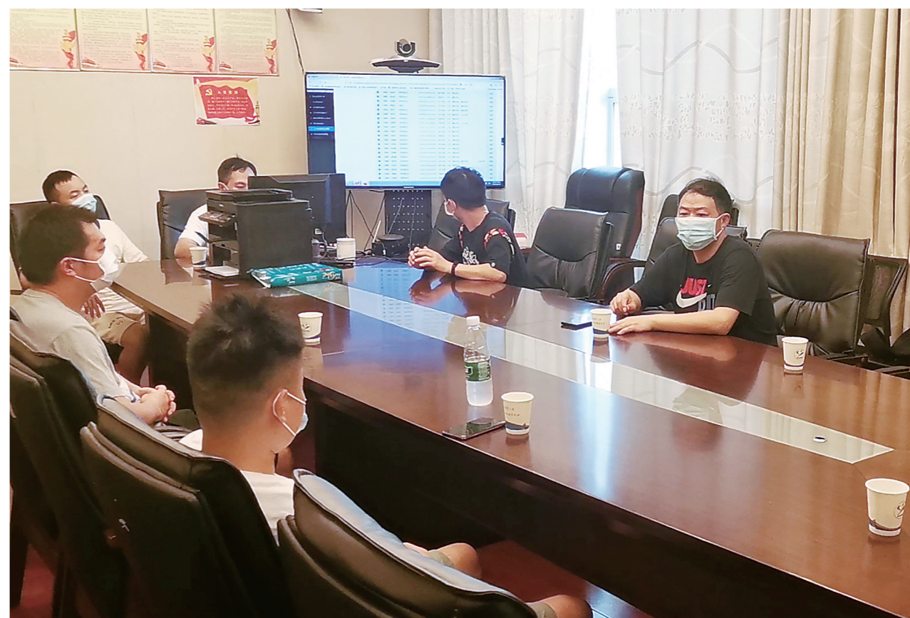
▲昨日,石峰区教育局举行义务教育学校新生均衡电脑分班,纪检组工作人员、家长代表、校方代表、媒体代表等现场见证。