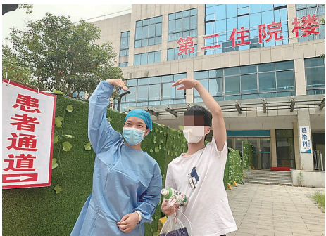
▲患者出院前与医护人员合影。

本报讯(株洲晚报融媒体记者/刘琼 通讯员/宋望)8月27日下午5时,在株洲市新冠肺炎定点医院,经专家组会诊,我市又有一名新冠肺炎确诊患者治愈出院。截至目前,本轮疫情我市共有5名确诊患者出院,一名无症状感染者解除医学观察。