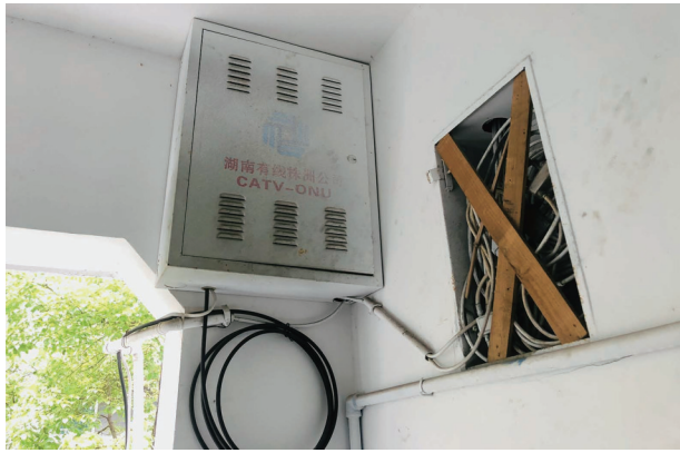
▲位于18栋楼道间的株洲有线电子设备盒。