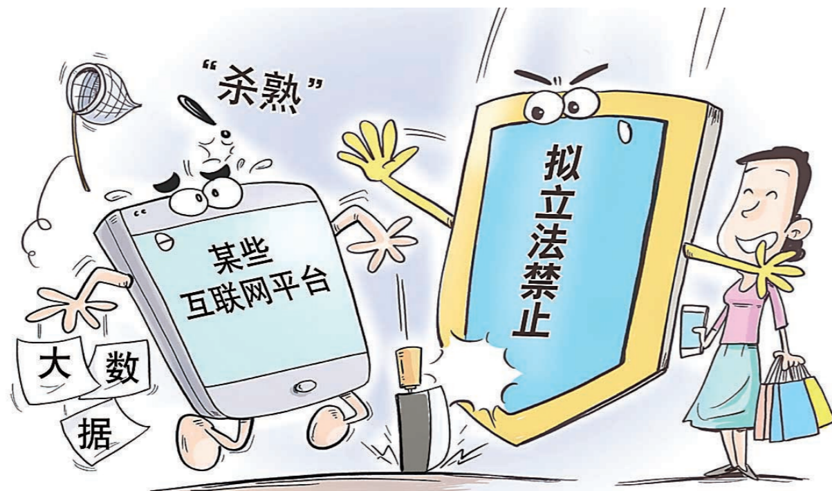
▲漫画:禁止“杀熟”。新华社发/王鹏 作

对于消费者来说,像“同一张机票,新老用户价格不一”这样的案例,屡见不鲜,无论是在网上购物,还是住宿、打车、吃饭等领域,经常有网友表示,自己又被大数据“割了韭菜”。因此,对于新保护法的实施,大家充满期待。