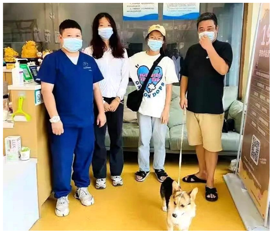
▲柯基犬失而复得,狗狗主人与宠物诊疗店工作人员合影。

本报讯(株洲晚报融媒体记者/沈全华 通讯员/谭哲)“幸亏办了狗证植入了电子芯片,走失5天的狗狗才找了回来!”近日,爱犬人士付某从天元区滨江南路的志和宠物医疗店领回自家的柯基犬时,开心地与该店工作人员合影。据了解,这是《株洲市城市养犬管理条例》实施以来,我市通过电子芯片找到狗狗主人的第一例。