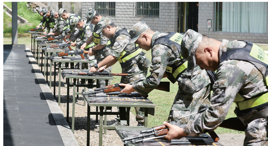
▲民兵正在进行武器分解训练。

骄阳似火、酷热难当,市民兵训练基地却“战味”十足。近日,我市首届民兵建制连军事挑战赛激情开赛。