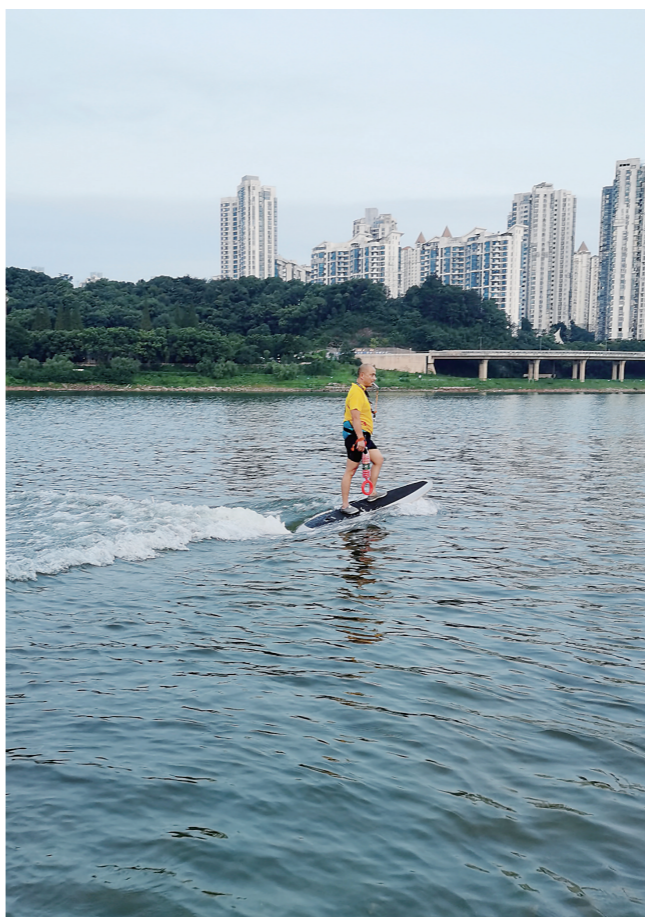
▲义务救援会会员演练时操纵电动水翼冲浪板驶向“溺水者”。