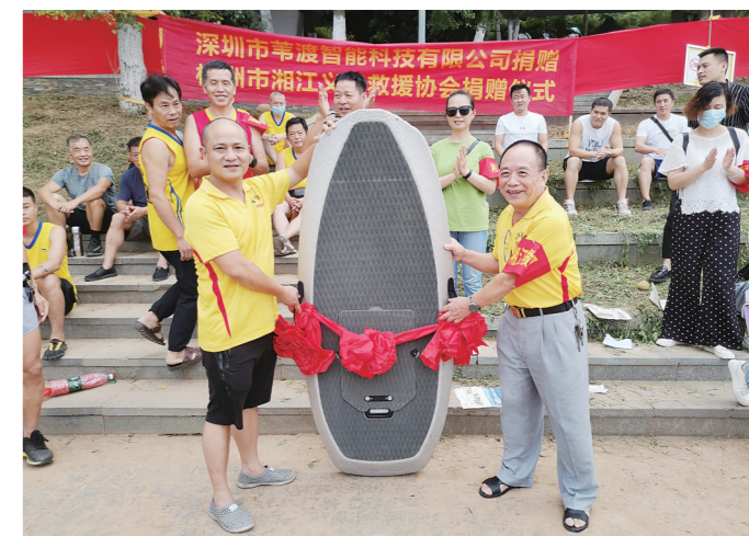
▲电动水翼冲浪板捐赠仪式现场。