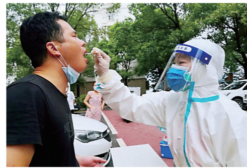
▲特殊作业记录抗疫瞬间。

赛,带领孩子们画出了心目中的美丽株洲,成为孩子们特殊而快乐的暑假“作业”。据悉,该活动还开设了《株洲这边风景独好》《我是株洲小导游》《百变的房子》的公益直播课堂,让孩子们在感受家乡巨变的的同时获得美育启蒙。“居家令”下达的特别暑期,市外国语学校学子们自觉添加了特殊的暑假“作业”:用绘画和摄影作品记录城市的抗疫瞬间,宣传抗疫。