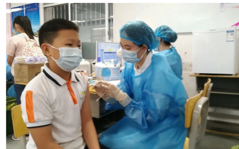
▲天台小学学生接种疫苗。

8月19日,荷塘小学发出“关于组织学生接种新冠疫苗的通知”,组织年满12周岁的学生接种新冠疫苗。通知要求学生们在规定时间内到校,避免提前或滞后,造成人员聚集。学生入校时必须接受体温测量,班主任在班级群确认健康码、行程码,体温异常和健康码为黄码、红码的人员一律不得入校。同时学校谢绝家长陪同入校,班主任负责组织学生排队前往接种场地。