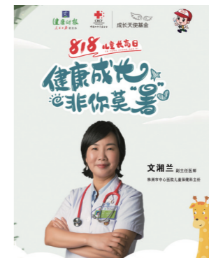
▲直播课堂宣传图。